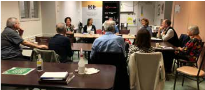
Café-rencontre. Hôpital de Chicoutimi