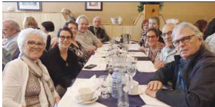
De grandes tablées

son style vestimentaire ; à la fois coquet avec ses petits foulards soyeux, ses chaussettes assorties, et l'originalité de ses lunettes rouges "flash".