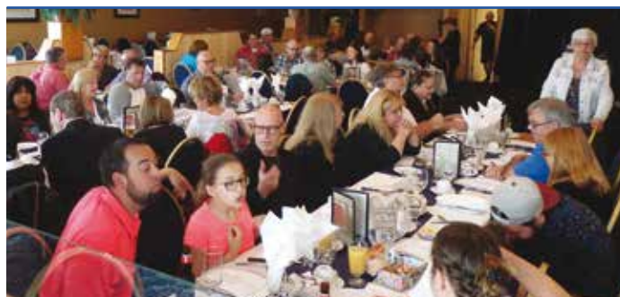
Une belle occasion de rencontre