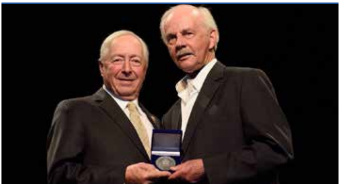
Médaille du lieutenant gouverneur du Québec pour bénévolat, 15 mai 2016.